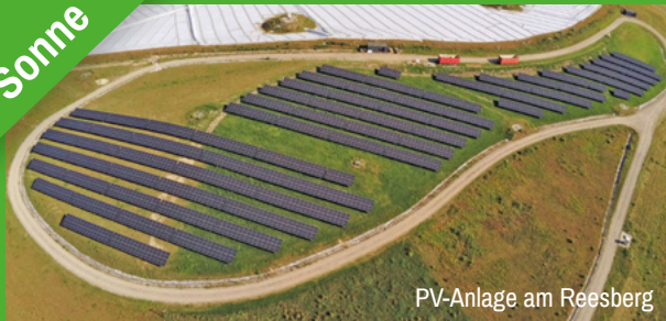
PV-Anlage am Reesberg